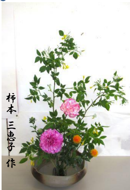
柿本 三恵子 作