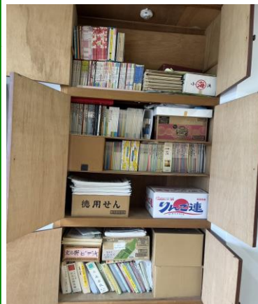
使用可能か物品検品や 必要書類可否の判断