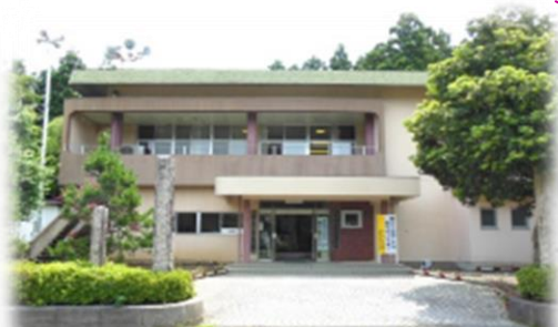
加斗コミュニティセンター