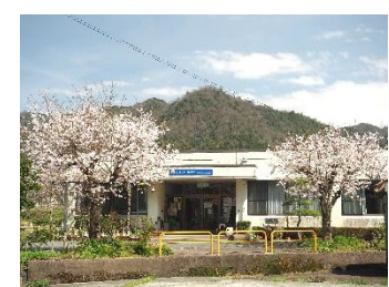
4月7日撮影 （上の桜も同じ日）