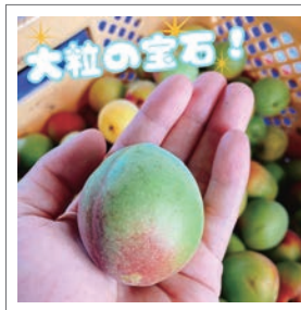
応募者：梅ジュース補給中さん

夏の練習後、真っ先に求めるのは「安中の青梅」で作ったキンキンに冷えた梅ジュースです。一口飲めば、梅本来の爽やかな香りが鼻を抜け、まるやかな甘みとスッパリとした後味が口いっぱいに広がります。この「爽快な美味しさ」が、疲れた体に最高に染み渡るんです。