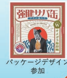
パッケージデザイン参加