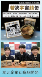
地元企業と商品開発