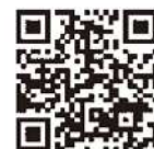
認証キーの取得方法 発注者への提出方法