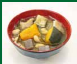
かいのこ汁（鹿児島県）