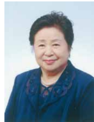
浅田クッキングスクール 校長