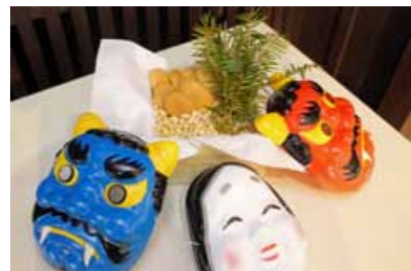
小浜の節分かざり