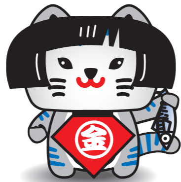
小浜市公認キャラクター 「さばトラななちゃん」