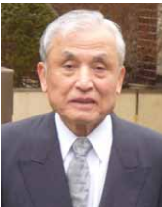
松蔭大学大学院教授 元芝浦メカトロニクス株式会社代表取締役社長