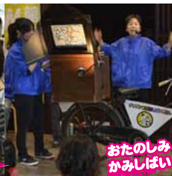
おたのしみかみしばい