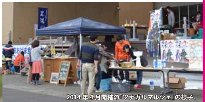
2014年4月開催の『ツナガルマルシェ』の様子。

全国の農業青年のマルシェを通じ、「食の多様さ」「食の持つ力」「小浜の食」を実感してもらい、「生産者・消費者・地域・市民・行政」などあらゆる人の繋がりが生まれる場にしたい。(主催者談)