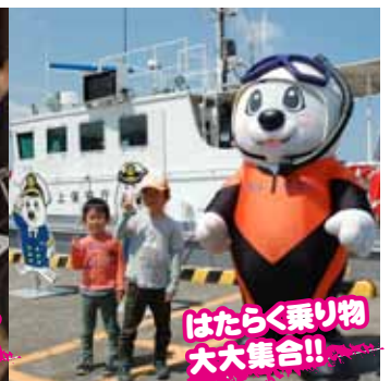
はたらく乗り物 大大集合!!