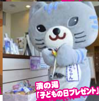
濱の場「子どもの日プレゼント」