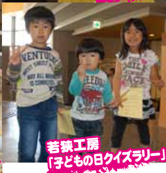
若狭工房「子どもの日クイズラリー」