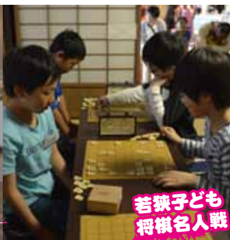
若狭子ども将棋名人戦