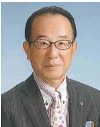
福井テレビジョン放送株式会社 代表取締役社長