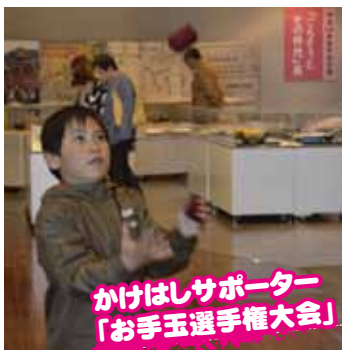
かけはしサポーター「お手玉選手権大会」