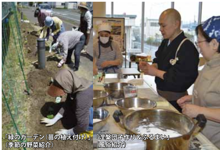
「緑のガーデン(苗の植え付け)」 (季節の野菜紹介)