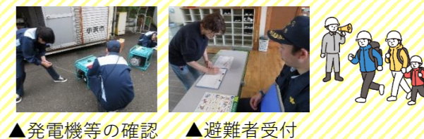
▲発電機等の確認 ▲避難者受付

小浜市全域で防災訓練・避難所開設訓練が行われた。今年度は豪雨等による土砂災害など被害を想定した訓練であり、朝に防災放送で避難指示が発令。その後、内外海コミュニティセンター和室を避難所開放し、非常時を想定した物資確認や状況確認を行いました。