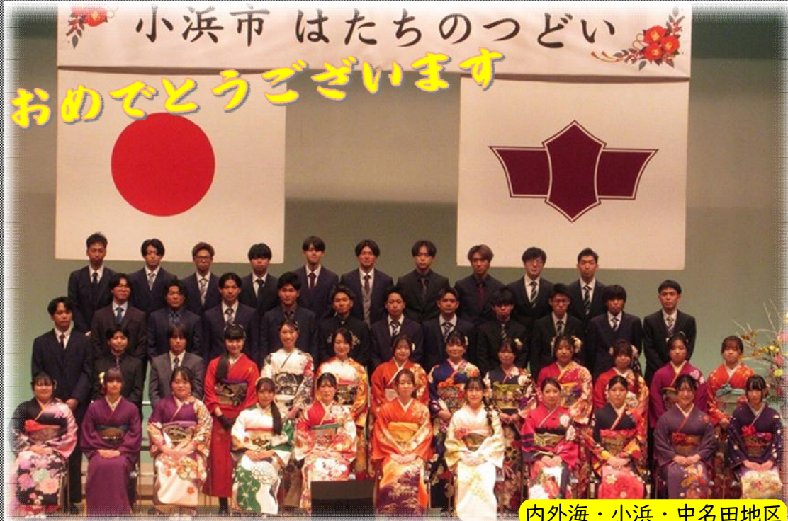
内外海・小浜・中名田地区