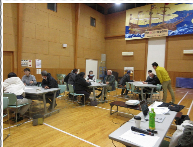
避難所は、各地区や自主防災組織が主体となって運営します。(運営者も被災者です。) 皆さんで協力しましょう!

2/28 (金) 防災講習会 まち協安全環境部会による、今年度3回目の防災講習会が開催され、18名参加しました。4班に分かれ、講師の松森先生から、避難所での様々な困り事を想定し、それぞれどう対処していったら良いか質問が出され、それをみんなで考えるという時間でした。最後には、避難所の重要なルールを考えたり、どのような役割が必要か組織表を作ったり、非常に考えさせられる有意義な講習会でした。