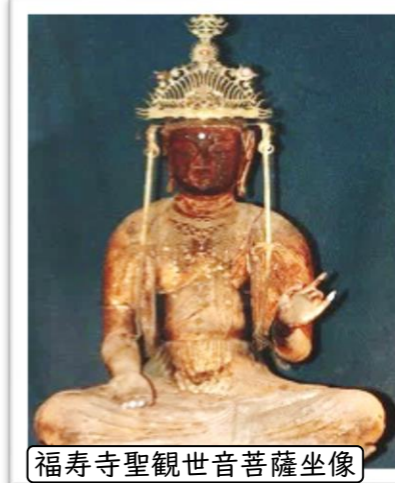
福寿寺聖観世音菩薩坐像

観音堂の前には村の方々がお待ちくださってました。由緒ある観音堂の梁には、菊のご紋章があり天皇家の勅願寺であることを物語っています。 下陣に入らしてもらいますと、有名な鶴退治の絵馬や手杵祭りの写真など展示されています。格子戸に眼をあてがって内陣を覗かせてもらっていますと『ここから内はめったに開けないやがあなたさんの冥途の土産に開けたげるわ』と鍵持ちの人が内陣に招き入れてくださいました。 『アー 立派な重厚なお厨子ですね。厨子の梁にも燦然と菊のご紋章が輝いており、柱には唐風の龍と立波が見受けられ古色蒼然としたおもむきを感じられます。』 ご本尊は絶対の秘仏で開帳しないと拝観はできませんが、お写真で拝見しますと聖観世音菩薩。坐像でお身丈は90センチ余り、檜材で彫りの浅い衣文などから平安後期の作と伝えられています。相好は優しく少女のような清純さが漂い、美々しい宝冠を頂かれ繊細な瓔珞をお付けになって気品に満ちた王女の風格も感じられます。眉間には仏の光を発せられる白毫があります。以前は燦然と輝く黄金でしたがいつの頃からコルクに摩り替えられ今は光もなく白く浮き出ているのがやるせない思いがいたします。