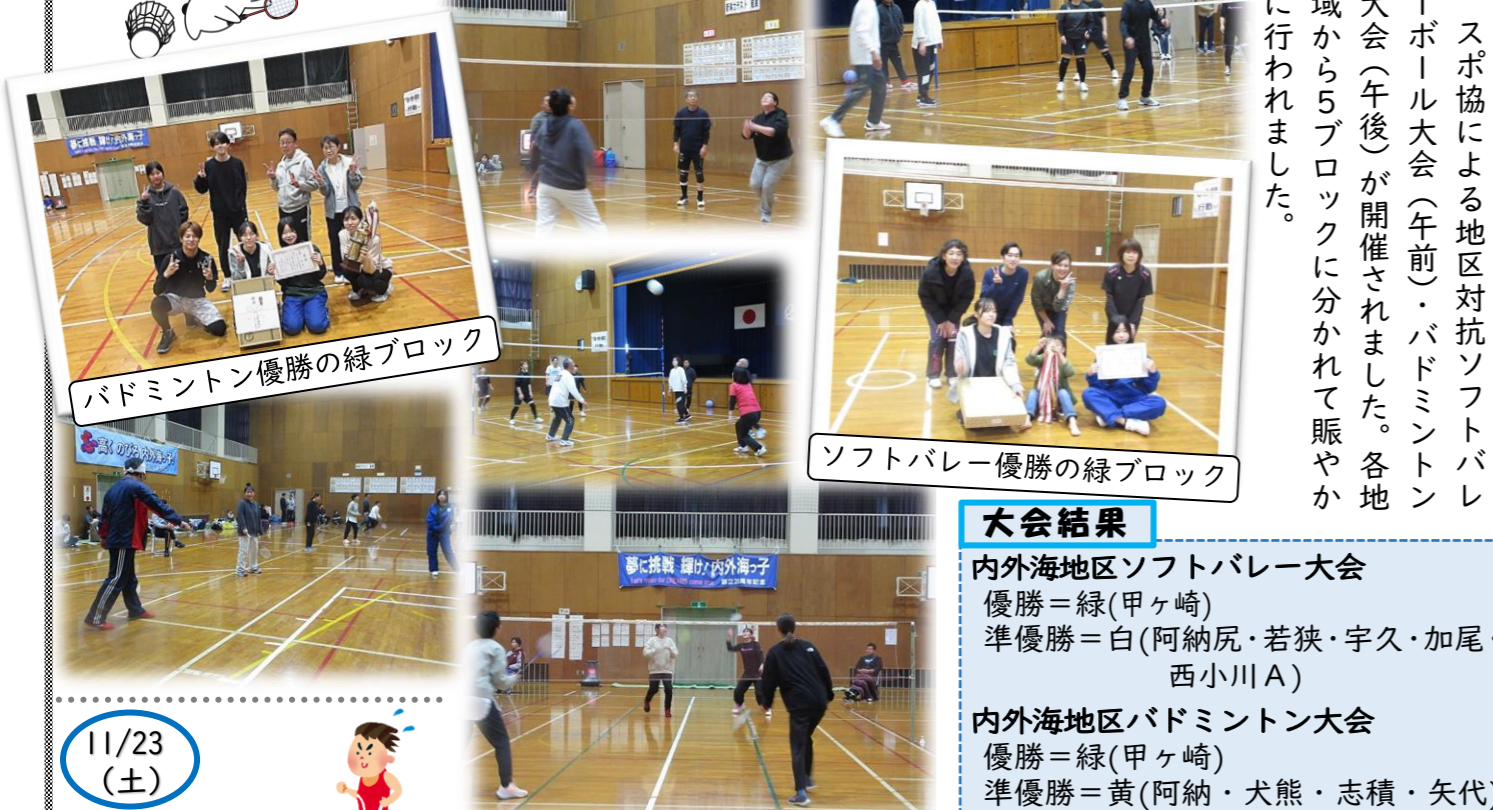
バドミントン優勝の緑ブロック