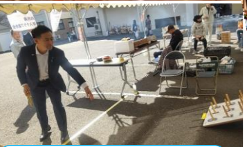
地区老連担当 ワナゲでは市長も挑戦