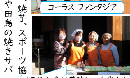
すこやか会は美味しい牛乳もち