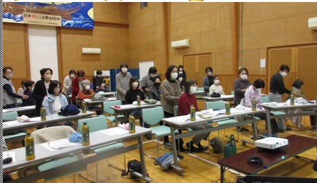
レジスタンス体操

参加者からは、「何回聞いても良い、忘れてしまいうこともあるし」「体操をしたから身体がすごく軽くなった」などの感想がありました。