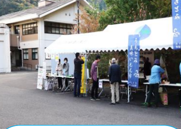
田烏は焼きサバ寿司他 朝市コーナーは、新鮮な野菜、 タコ飯、ヘルシー弁当、揚げた てのタイカツなど