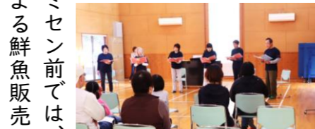
コーラス ファンタジア