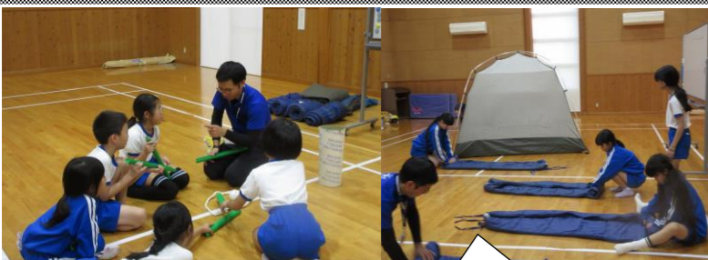
高学年は、寝袋の収納

11月12日(火)に放課後教室が行われ、内外海児童15名が参加しました。宿題会、カルタ教室、体験学習が行われ、若狭湾青少年自然の家の協力により、ホールでテントの組み立て体験、寝袋体験、ゲームなどをしました。この体験では、人とのつながり、仲間と協力しながら、ひとつの作業を完成させる大切さを学びました。