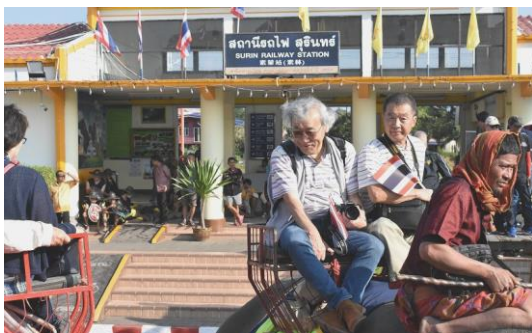
象パレードの象に乗る (11月15日)