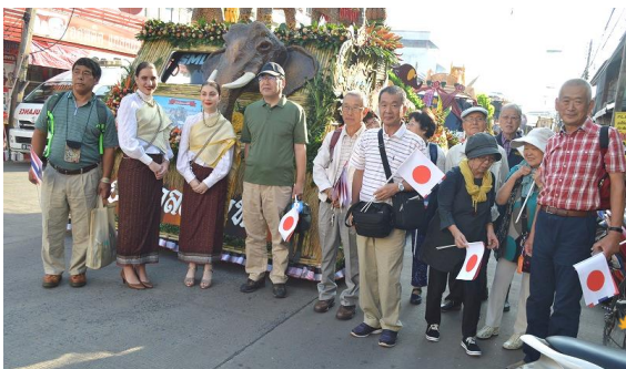
タイ王国浜北親善使節メンバー (11月15日)