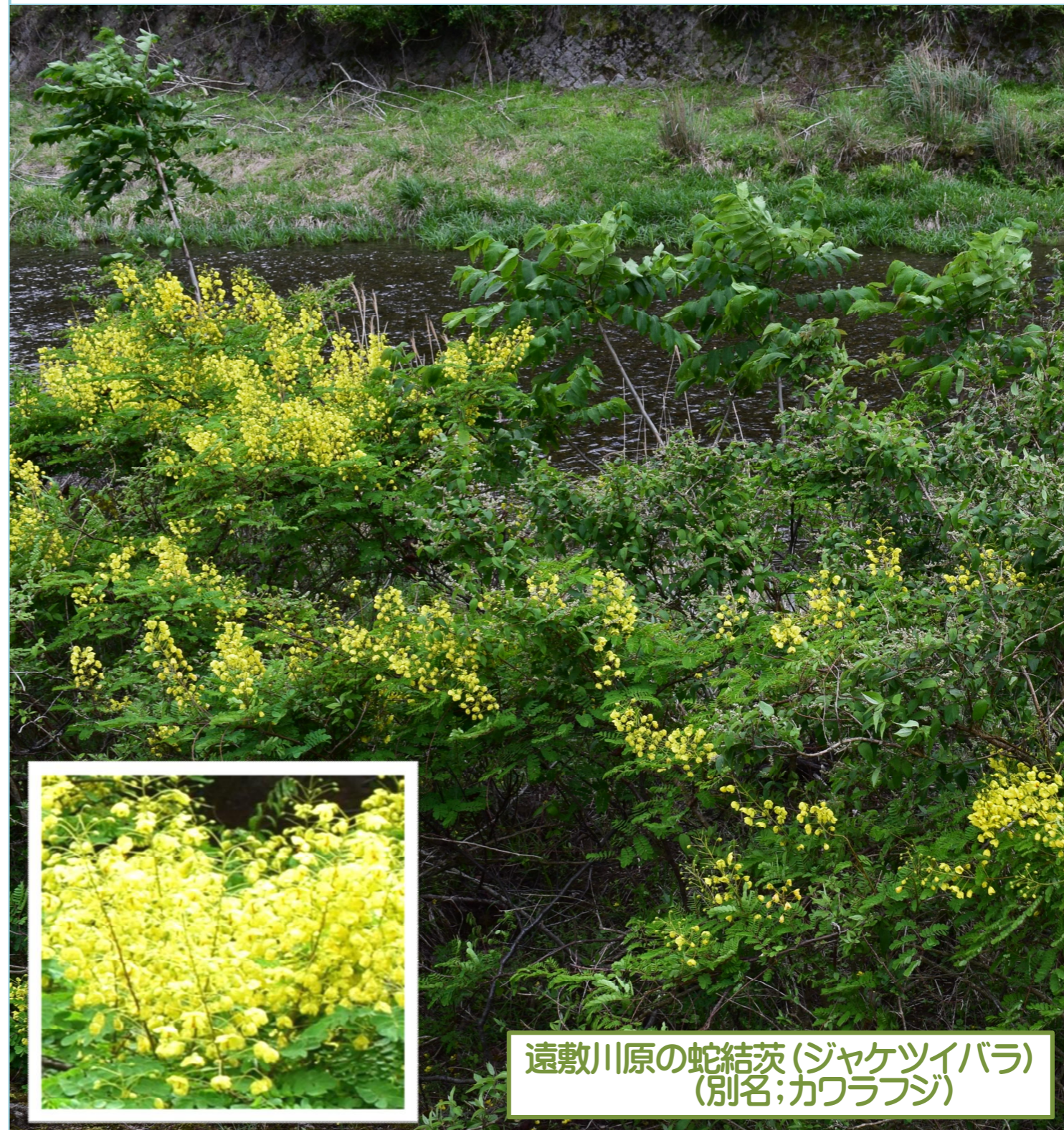
遠敷川原の蛇結茨(ジャケツイバラ) (別名:カワラフジ)