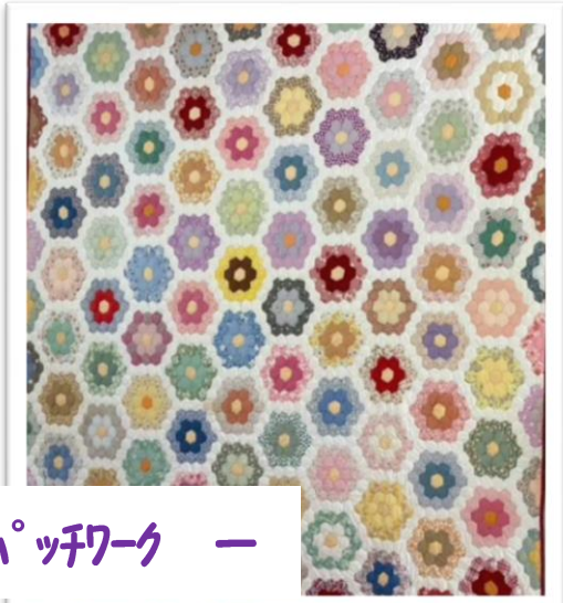
— パッチワーク —