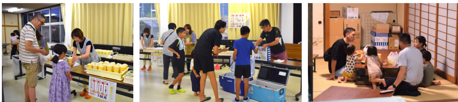
ノンアル酒場にはジュース類ももちろんあります。1階和室は食事・休憩所として開放、隣の会議室には観戦コーナーも。