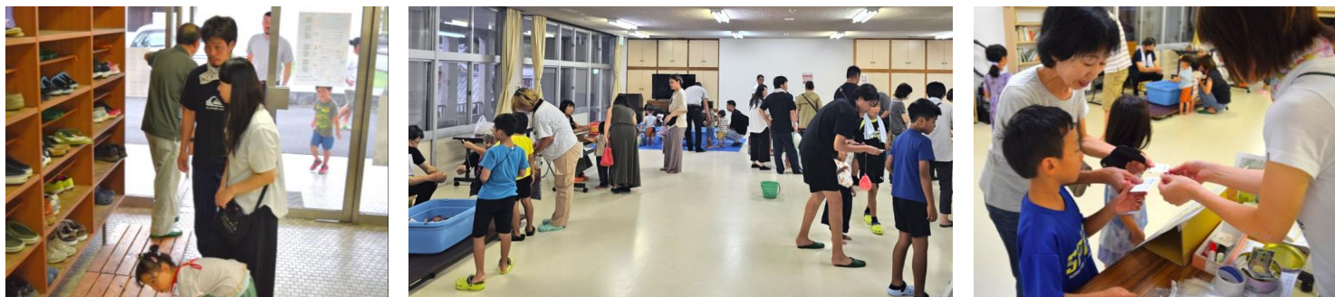
開始すぐの、まだ明るい時間帯から多くの家族連れがご来場。お子さんは100円の「入場手形」で全ゲームコーナーまわられます。