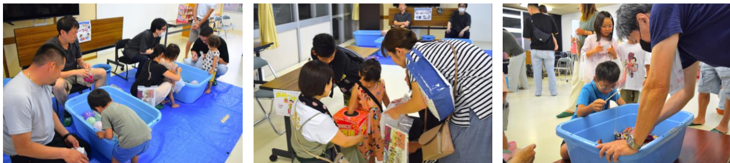
うまく取れるかな? ...と思っていたら、写真中央のアメつかみでは皆予想以上にうまくて、途中で景品がなくなりそうに。