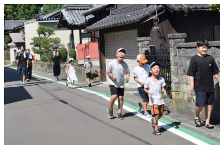
市場区・島区を巡る子どもたち