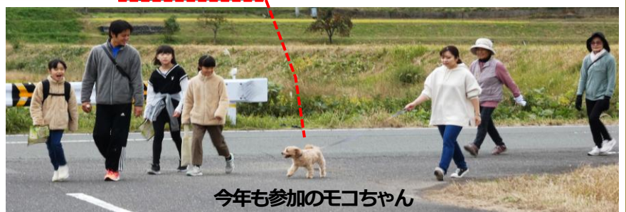
今年も参加のモコちゃん

◀ ゴールで 待っていたのは あばん亭さん 特製カレーライ スとサラダ 飲料もあわせて 参加者にふるま われました