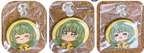
▲ 缶バッジ ◀ ステッカー アクリルキーホルダー ▲

▼ キャラクターグッズ販売 この日だけの特別セット+特別価格 宮川まち協公認キャラクター 宮里 ひまわり