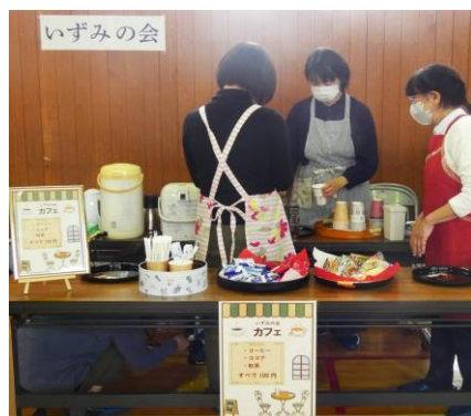
▲ カフェ販売 いずみの会