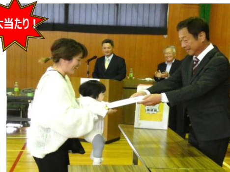
▲ 各団体長さんの特別賞もあり 超豪華! ありがとうございます