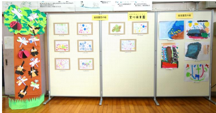
▲ 宮川保育園児14人の絵