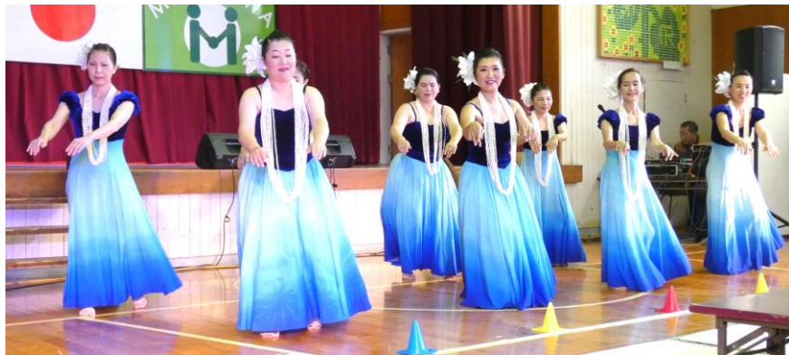
館内が一転 華やいだよ 優雅で可憐 素敵だね