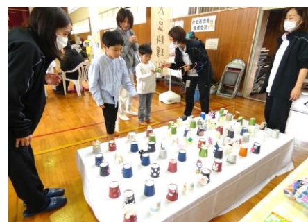
▲ 輪投げゲーム 子どもに大人気！ 社会福祉法人 積心会 ひまわり荘