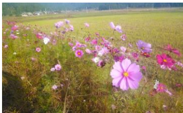
撮影日10月27日 竹長区のコスモス

「若狭の恵」さんのコスモスは他にもアイザワ商店さんの前でキレイに咲いたよ 竹長区有志の皆さんのコスモスもキレイに咲いてよかったね ひまも地区内を散歩してインスタグラムに投稿してるよのぞいて見てね