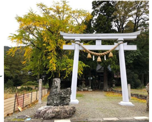
撮影日11月12日 貴船神社と近辺