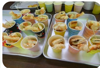
◀ ひとくち パイ販売 ひまわりクラブ コーヒーと セットで おいしかった