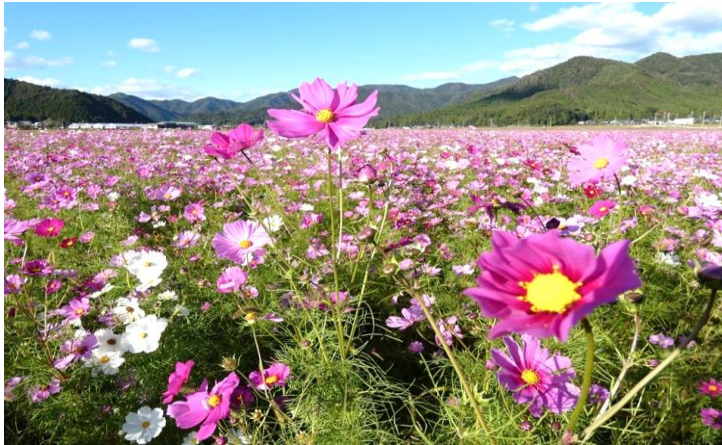
撮影日10月30日 加茂区・長泉寺前のコスモス