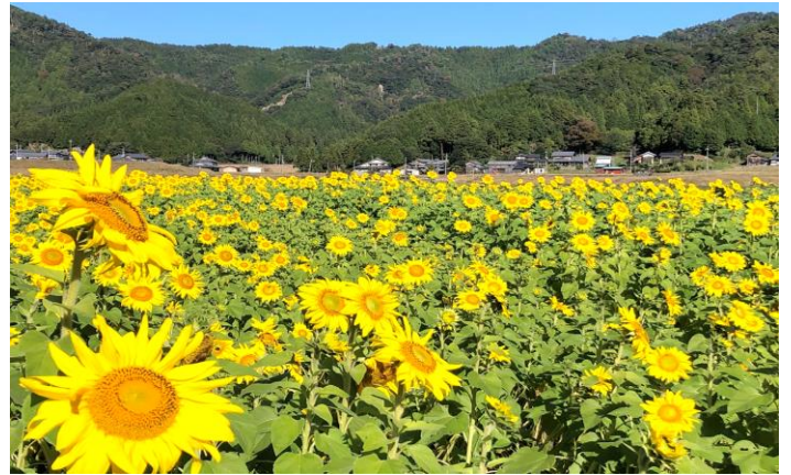
撮影日10月31日 本保区のみまわり