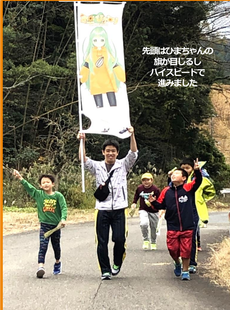
先頭はひまちゃんの旗が目じるし ハイスピードで 進みました