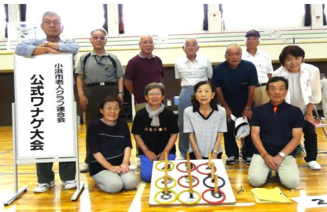
▲宮川老人クラブ11人の代表選手のみなさん

市民体育館において開催された小浜市老人クラブ連合 会の公式ワナゲ大会に、宮川老人クラブから11人の代 表選手が出場し健闘しました。