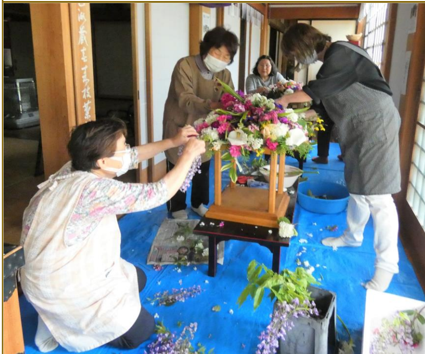
6日午後から、花を持ち寄り「花見堂」が作られました。