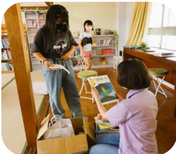
本探しゲームのクイズ作りに協力してくれた青年クラブ図書室なおし隊の皆さん、ありがとう！