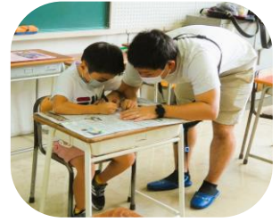
キーホルダーは満足に しあがったかな？

実験教室のあとはプラバンキーホルダー作り。見本の図柄を写し取り、色付け作業。集中してキーホルダー作りを楽しみました。親子参加もあり楽しそうな姿を見てこちらもうれしく思いました。