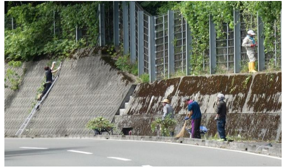
▲沿道で作業をおこなう大戸区の皆さん