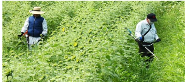
広いひまわり畑の周囲から始まり畑の中へ