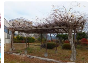
▲農村公園の藤棚も補強され春を待ちます