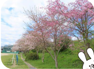
【今富小学校グラウンド】