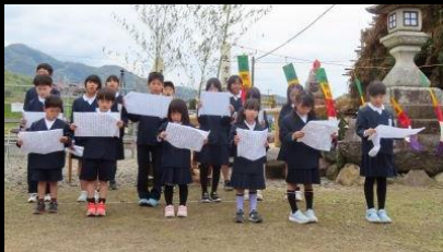
和久里区の小学生が読み上げます

*今富小学校の子ども達の壬生狂言は、ふるさとまつり(11/1)や 県公民館大会(10/15)で披露する予定です。