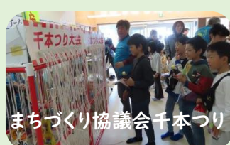
まちづくり協議会千本つり