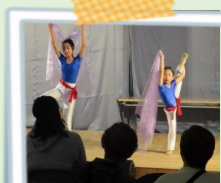
小浜新体操クラブ