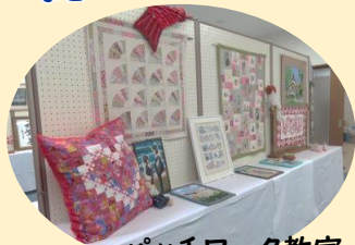
パッチワーク教室