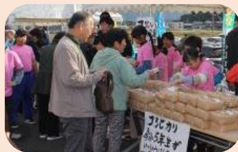
今富小学生が作った コシヒカリ販売