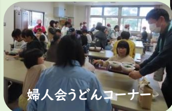
婦人会うどんコーナー

多くの方にご来場いただき、にぎやかで温かい催しとなりました。ご協力いただいた区長会・関係団体・出演者・スタッフのみなさんありがとうございました。