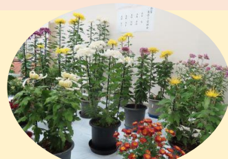
今富菊作り愛好会