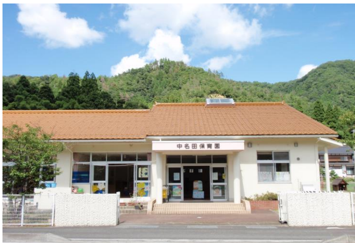
中名田保育園 園舎（玄関口）

このように地域の中で、そして家庭との連携を密にして、子どもが安定した気持ちで生活ができるように心配りをしながら保育にあたっております。