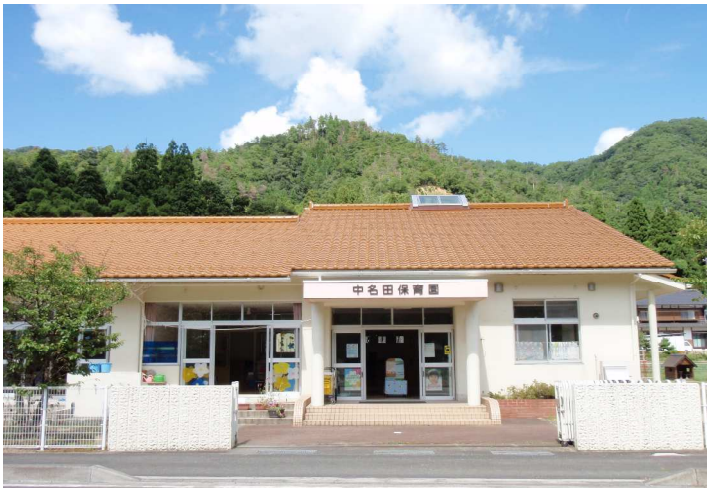
中名田保育園 園舎（玄関口）

このように地域の中で、そして家庭との連携を密にして、子どもが安定した気持ちで生活ができるように心配りをしながら保育にあたっております。