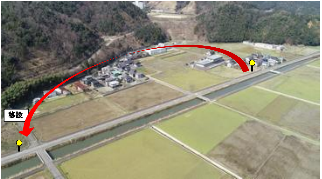
(福井県 HP「土地利用一体型水防災事業 一級河川 江古川」より加工)