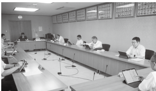
議会運営委員会の様子

5月30日に市役所にて、講師を招き、タブレット端末の基本操作の研修を行いました。