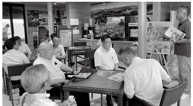
現地視察において説明を受けました

議員から、小浜市のエンゼルライン活用の参考とするために、上下水道施設の整備方法について質疑があったほか、レインボーラインを訪れた方の宿泊先や、他にどのような観光地を訪れているかといった質疑がありました。