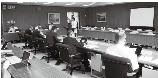
講師の説明に耳を傾ける議員