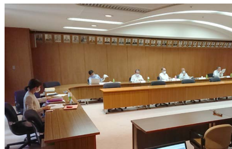
調査・議論を重ねました

②観光客のみならず、市民に向けても広く日本遺産に関する取組内容を周知し、観光ガイドなどの取組みを担う人