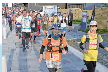
▲鯖街道ウルトラマラソン