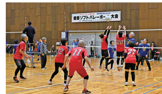
▲御食国若狭おばま杯親善ソフトバレーボール大会