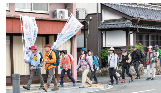
▲鯖街道ウォーキング