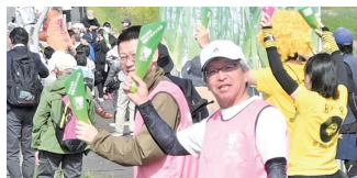
▲ハンドクラッカーでの応援