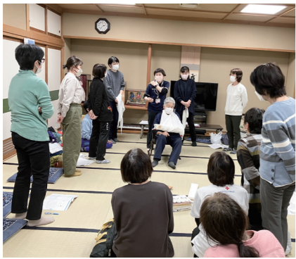
▲三角巾を使った応急処置を学習

心肺蘇生法やAED操作、けがの手当てなどをはじめとする応急処置の仕方のほか、災害時の心得なども学びます。