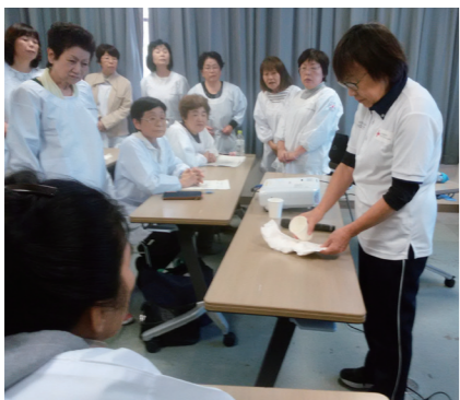
▲おむつの交換方法などを学習