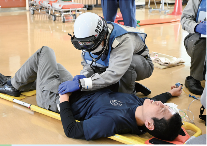
救命技術・知識を向上 救急想定訓練会 救急救命士など職員約 30 人がさまざまな状況に対応する技術や知識を習得（若狭消防署・2月25日）