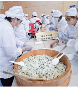
▲防災訓練でおにぎり作り

市や県が実施する防災訓練で、おにぎり作りのほか、専用の炊飯袋を使用し、少量の水で調理可能な「ハイゼックス炊飯」の実践など、災害時を想定した炊き出しを行います。