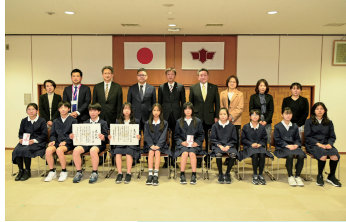
功績たたえる 小浜市教育委員会表彰 地域連携の学習に功績のあった西津小学校 6 年生と中名田小学校 5・6 年生を表彰（市庁舎・2月26日）