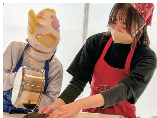
▲参加者と一緒いでっちゃんを作る

1月には、グループ「でっちゃん」の皆さんと一緒に、「でっちゃん」の作り方を参加者に伝えました。