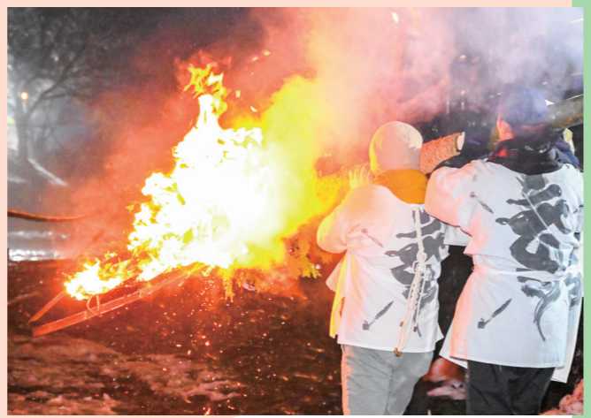
火と水の神事 厳かに 若狭地方に春を告げる伝統行事「お水送り」が営まれたいまつ行列が夜の静寂を照らす（下根来・3月2日）