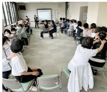
▲リラクゼーションの方法を学習

フレイル予防や介護支援のために、介護する人・介護される人の負担を少なくする工夫などの知識や技術を習得します。