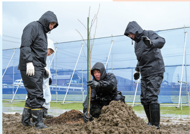
利用者らが桃の苗木 10 本を植樹 利用者の収入確保などを目的に就労継続支援 B 型事業所の株式会社縁が桃農園を開設（府中・3月3日）