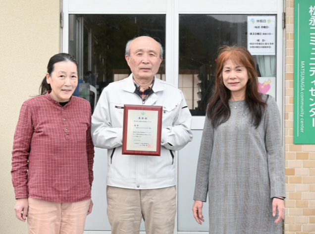
第 10 回全国公民館報コンクール 金賞 松永コミュニティセンターが住民の協力のもと発行する広報紙「まつなが」が最高位を受賞（上野）