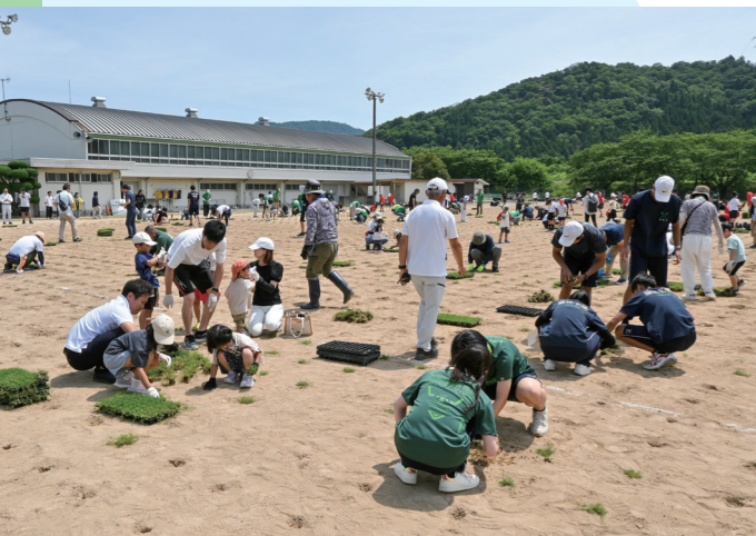
グラウンドを芝生化し地域の憩いの場に グリーンプロジェクト 若狭東高校 Green Project が開催。同校生徒をはじめとする約450人が参加（金屋・6月8日）