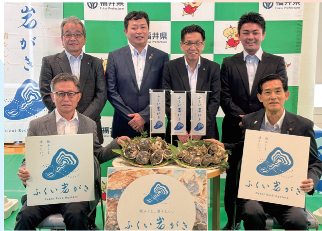
夏の新たな特産品に「ふくい岩がき」 県が小浜市や関係機関などと協力して養殖に取り組んだイワガキのブランド化を発表（食文化館・6月4日）