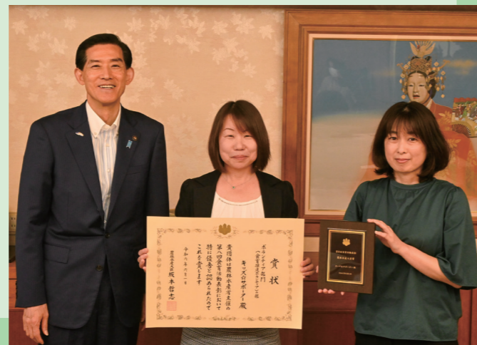
第8回食育活動推進表彰 農林水産大臣賞受賞 幼児の料理教室「キッズ・キッチン」などを運営するキッズ☆サポーターが市長へ受賞を報告（市庁舎・6月6日）