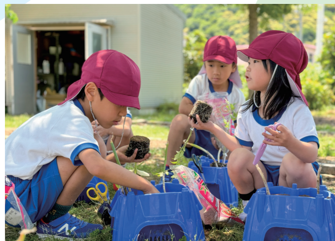
生き物を育てる大切さや成長過程などを学ぶ 小浜小学校2年生42人が講師に教わりながらトマトやキュウリなど夏野菜の苗植えに挑戦（駅前町・5月17日）