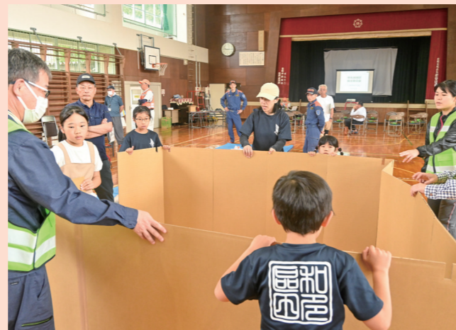
出水期に備える 小浜市防災（水防）訓練 災害時に避難所となる中名田小学校では地域住民が避難所用物資の設営方法を学ぶ（下田・5月25日）