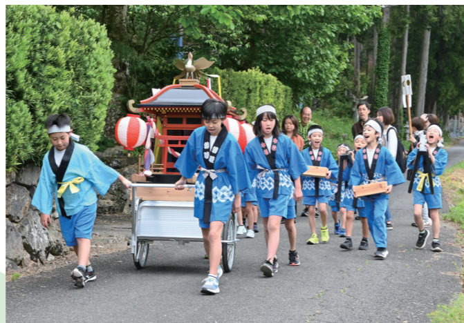
豊作を祈願 太良庄区子どもみこし 区内の小学生14人が元気な声を上げながら同区内約60軒の家々を巡行（太良庄・5月18日）