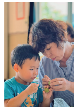
（加斗保育園・6月11日）

おじいちゃん・おばあちゃんを保育園に招待し交流する「祖父母との集い」。練習した歌を園児全員で披露した後、一緒に梅ジュースを作りました