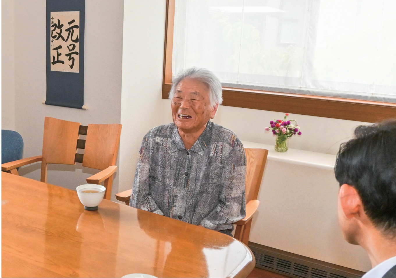
松崎市長が百寿を迎える高齢者を訪問