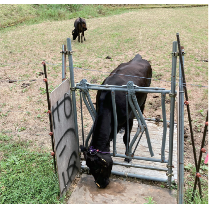
農地を牛の放牧に利活用(小屋)