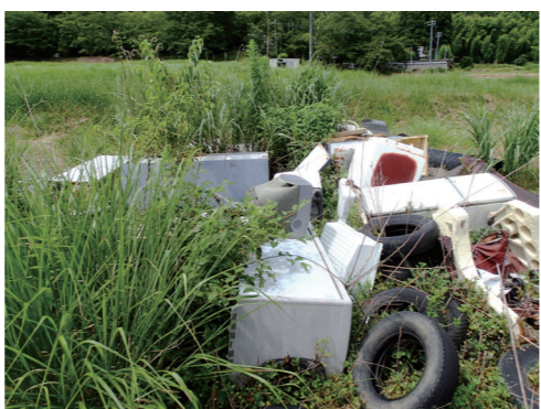
不法投棄されたごみ