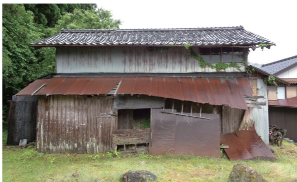
一部が破損した空き家

あなたが放っておいた「モノ」のせいで他の人が迷惑しているということを認識し、自分の持ち「モノ」は管理を徹底しましょう。また、管理しきれない場合は、利活用や適正な処分の方法を考えましょう。