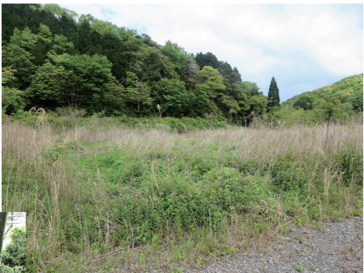
雑草が生い茂った遊休農地