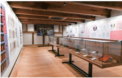
▲「GOSHOKEN」で展示されている若狭塗

若狭小浜の自然を大切に作る心から生まれた若狭塗は、伝統的な技術と当時の美意識を現在まで継承しています。私たちが知る若狭塗は、長い歴史の一部なのかもしれないかもしれません。