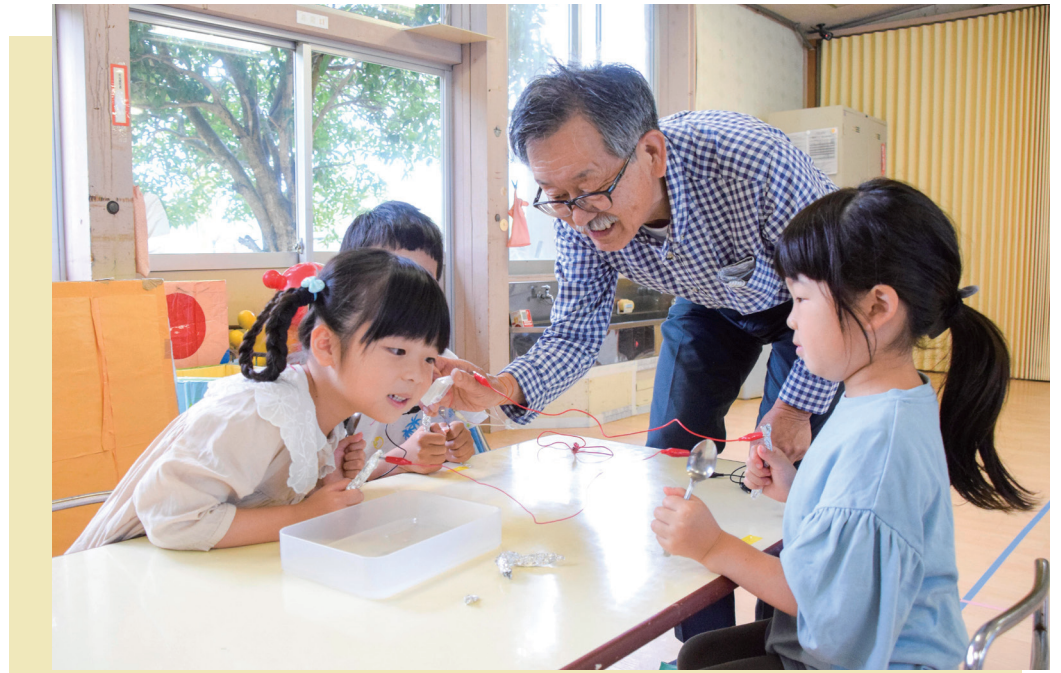
スプーンとアルミ箔の電池でオルゴールを鳴らす実験(松永保育園・6月22日)

https://www1.city.obama.fukui.jp/ kouhou@city.obama.lg.jp 若越印刷(株)小浜営業所