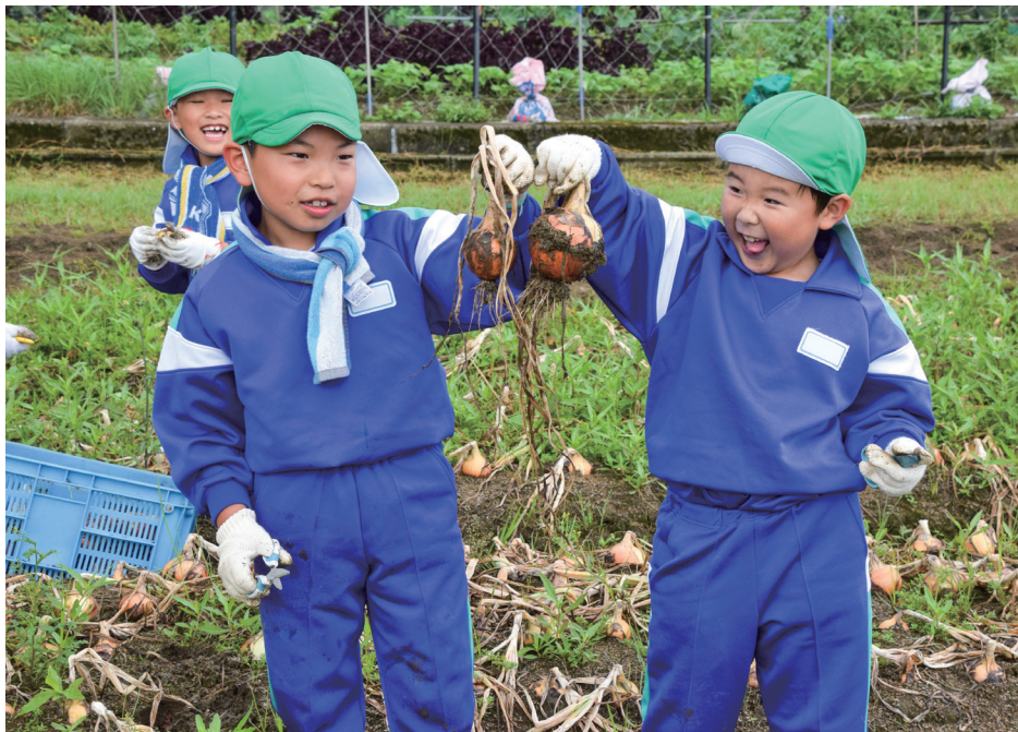
今富小学校2年生がタマネギの収穫を体験(木崎・6月23日)