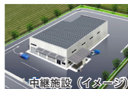
中継施設（イメージ）

中継施設に持ち込まれたごみは、最終的に大型の運搬車で新施設へと運び、焼却処理します。