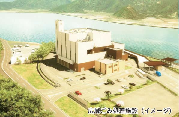
広域ごみ処理施設（イメージ）

小浜市、若狭町、おおい町、高浜町で構成する「若狭広域行政事務組合」では、各市町の可燃ごみ焼却施設が老朽化していることから、共同で新たな広域ごみ処理施設の建設を進めています。新施設の概要や工事スケジュールをお知らせします。