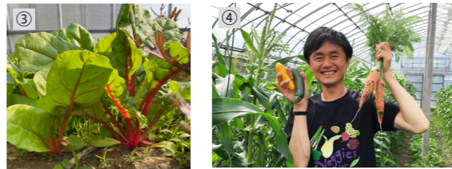
①しま模様が特徴的なゼブラナス。加熱するととろけるような食感を楽しめる②コリンキーは、国内で品種改良されたカボチャの一種。生食や浅漬けにして食べられる③スイスチャードは別名「虹色菜」。茎や葉脈が赤・紫・黄・オレンジなどさまざまに色付く