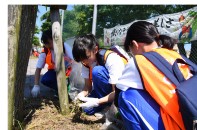
清掃活動「クリーンアップ作戦」の様子（平成30年6月3日・駅前町）

市では毎年、市民の皆さんにも協力をいただいて、市内の清掃活動を実施しています。作業の際に、オオキンケイギクなどが生えているのを見つけたら、次のことに注意して駆除していただくようお願いします。