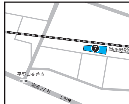
⑦平野 20-4-5 ほか 3 筆