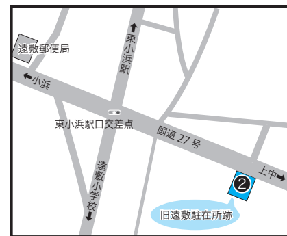
②遠敷 74-17-2 ほか 3 筆