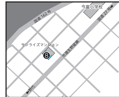
⑧生守 6-15 ほか 1 筆