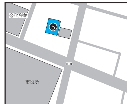
⑤四谷町 22-49-1 ほか 1 筆