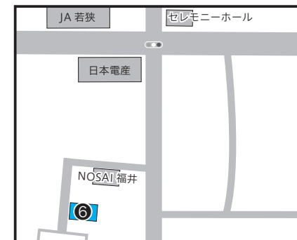
⑥遠敷 33-16 ほか 1 筆