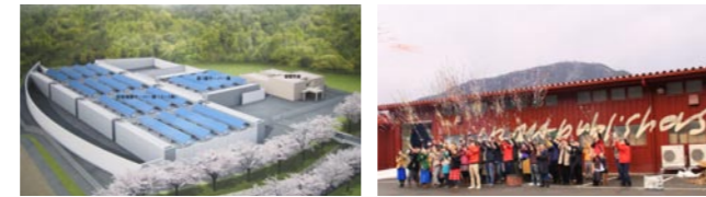
データセンター新設(多田) 物流センター新設(平野) ※空き工場の活用