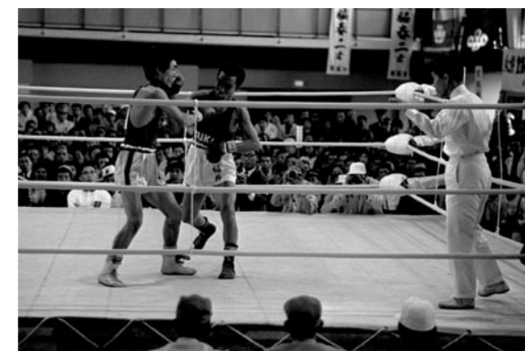
第23回国民体育大会、ボクシング（昭和43年・若狭高校）

福井県で、次に国民体育大会が開催されるのは平成30年の予定です。次は、どんな競技が小浜市で開催されるのでしょうか。