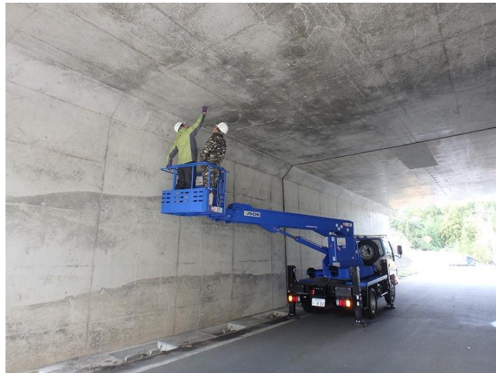
近接目視により行うことを基本とする（写真参照）

破壊検査などを適用する。結果については4段階で区分するとともに、区分に応じ適切に措置を講じる。また、定期点検等の結果に基づき、大型カルバートの対外的な影響も考慮して重要度を評価し、経費の平準化にも配慮しながら優先度の高いものから順に修繕を実施し、効率的・効果的な維持管理を行う。