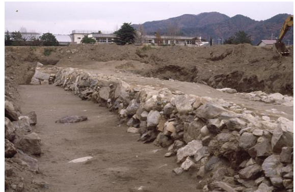
西の丸海側石垣跡