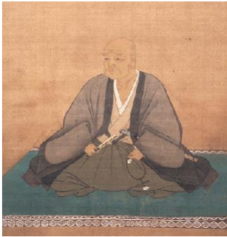
小浜城を完成した 酒井忠勝公