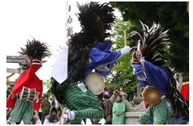
小浜神社祭礼で 奉納する雲浜獅子