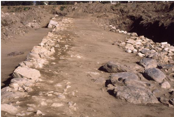
西の丸海側石垣跡