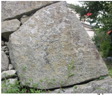
石垣に残る刻印 (中央)