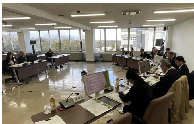
亀山市での視察の様子（三重県亀山市役所）

市が直接建設すれば、市営住宅は市の財産になるため、同市の職員や議員からは直接建設方式を推す声が多く聞かれたが、将来的に負の財産になることも考えられ、それを抱えるリスクを減らすことを選択したとのことであった。