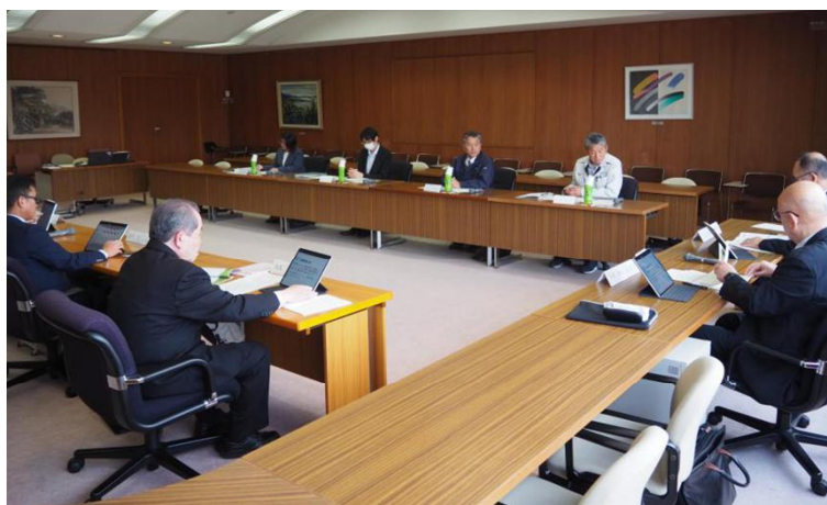
活発に意見を出し合う参加者（小浜市役所）

さらに、集合住宅だけでなく、戸建ての空き家の利活用も視野に入れるべきではないかとの提案もあった。