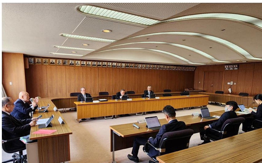
議員間討議の様子（小浜市役所）