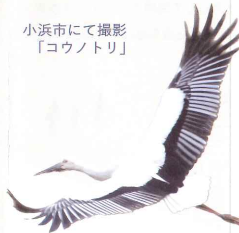
小浜市にて撮影 「コウノトリ」