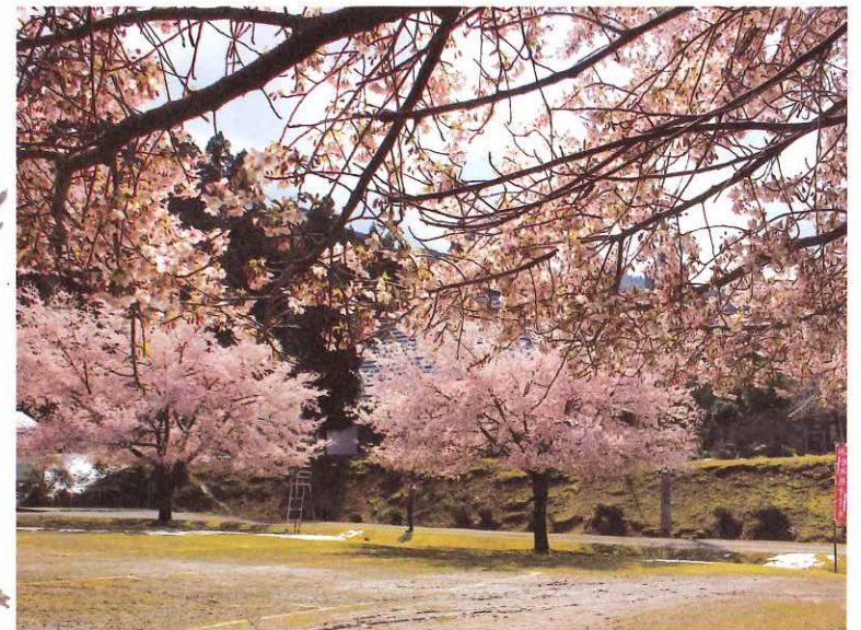
小浜市飯盛寺にて2024年3月撮影「桜」