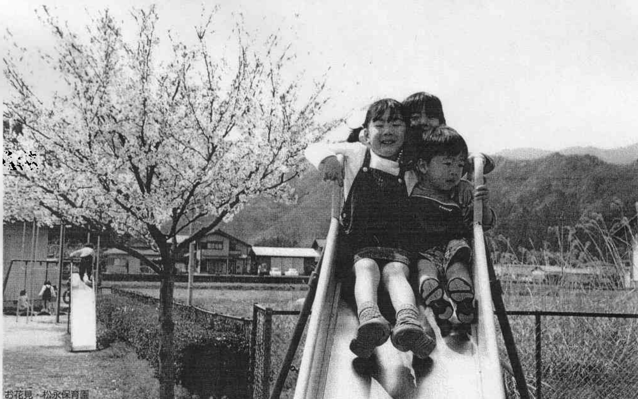
お花見 松永保育園