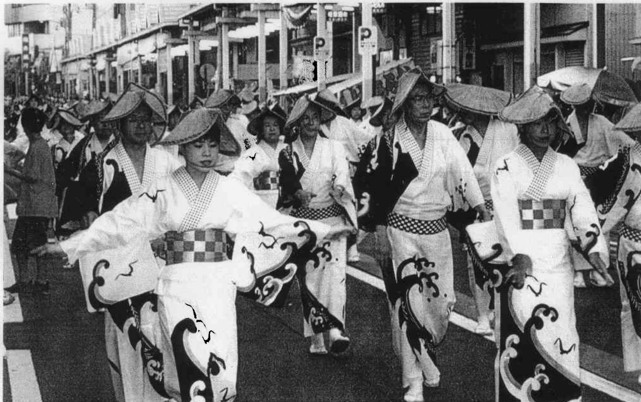
若狭マリンピア小浜音頭おどりパレード (7月31日)