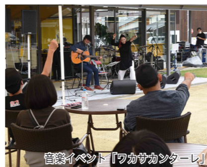
音楽イベント「ワカサカントーレ」 市内外から音楽愛好家が集い、さまざまなジャンルの音楽で聴衆を魅了

また、町中にある開けた空間として子どもたちの遊び場にもなっており、季節に合わせた人工芝マットやイルミネーションを設置するなど、市民が気軽に立ち寄れる憩いの場にも活用されています。