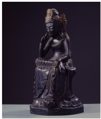
▲昭和33年に盗難された際は鳥取県で発見され、無事に戻ってきました

太良庄にある正林庵では、高さ33センチの小さな仏像が大切に守られています。この仏像「銅造如意輪観音半跏像」は、奈良時代に制作されたと考えられ、国の重要文化財に指定されている県内最古の金銅仏（銅製の仏像を金で装飾したもの）です。鎌倉時代に、東寺（京都市）から同寺の荘園である太良庄へ伝わったとされています。