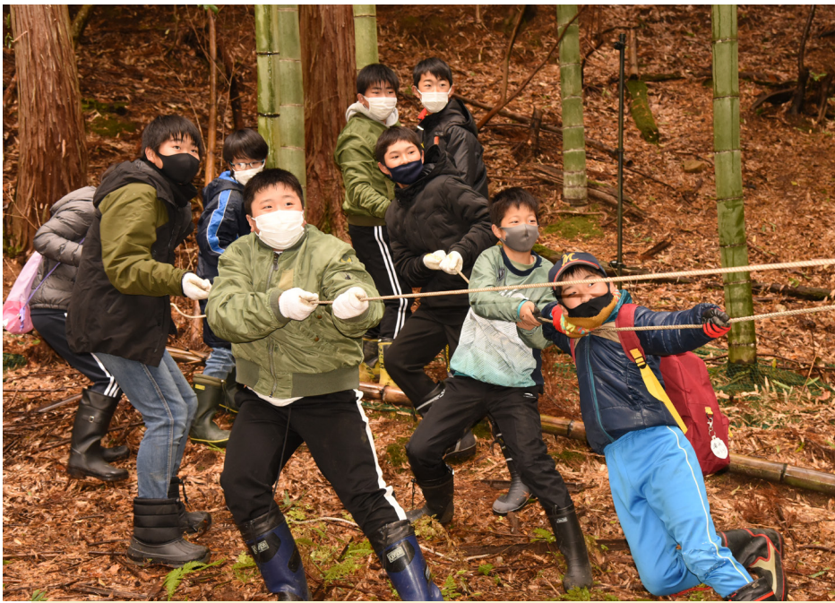
お水送りの準備「竹起こし」で小浜美郷小学生が竹を引き倒す(神宮寺・12月5日)