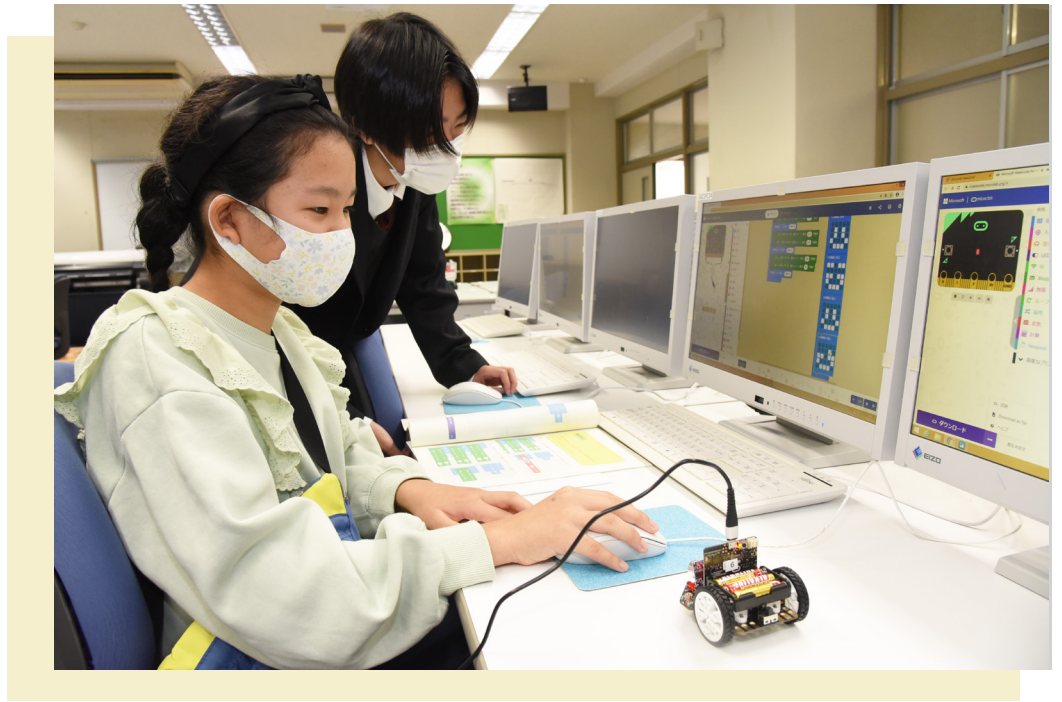
小学生が高校生にプログラミングを教わる(若狭東高校・11月21日)

https://www1.city.obama.fukui.jp/ kouhou@city.obama.fukui.jp 若越印刷(株)小浜営業所