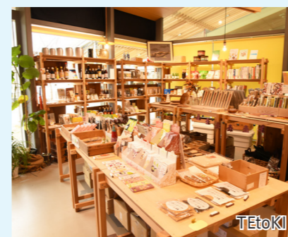
TEtoKI 地場産品以外にも、食の本や、全国から選んだこだわりの調味料や菓子が並ぶ