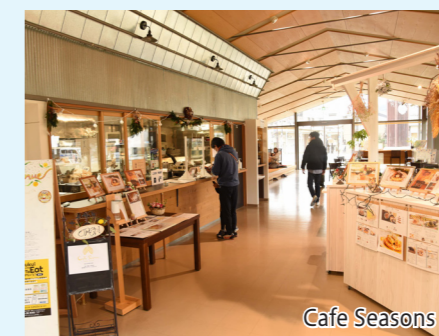
Cafe Seasons 休憩施設を兼ねる客席で、乳製品・卵などを使わないワッフルやパスタが楽しめる

棟内は無料WiFiが整備されており、休憩コーナーをちよつとした仕事や勉強に利用する人も。また、不定期に市内の飲食店などが出店するシェアキッチンや、小浜藩医・杉田玄白ゆかりの品々を展示するコーナーもあります。