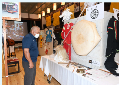
小浜地区の伝統行事「放生祭」の衣装などを展示した「放生otoph」

②芝居小屋「旭座」 住吉区に現存していた明治期の芝居小屋を移築復原したものです。かつては全国に3000以上あった芝居小屋も、現在は30あまりしか残っておらず、県内に唯一残る貴重な文化遺産として、市指定文化財に指定されています。 現在は、大衆演劇の興行や、上方落語協会と連携した落語会などの催しに活用。「ちりとてちん杯 全国女性落語大会」では、全国の女性落語家と市民との交歓の場になっています。