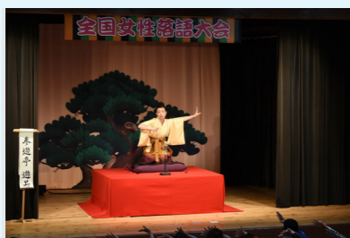
「全国女性落語大会」が開かれる旭座は、女性落語の「聖地」にもなっている