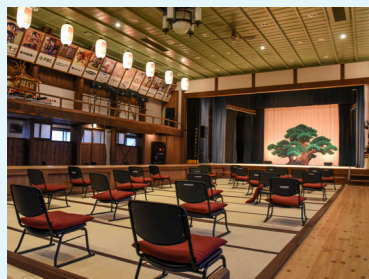
「旭座」内観。1階客席の間を通り舞台へ続く花道や、2階の棧敷席も復原されている