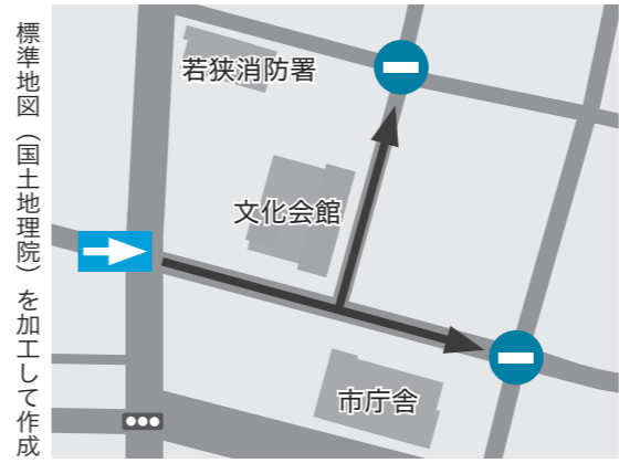
標準地図(国土地理院)を加工して作成