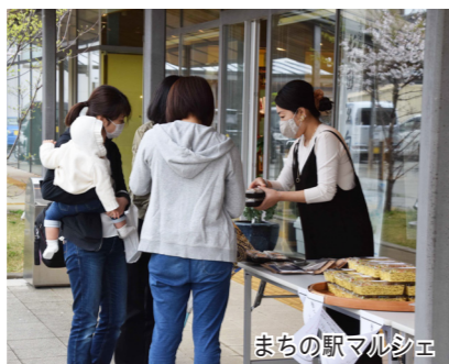
弁当や野菜、雑貨などの販売や、市民らによる作品展示などが行われる

屋外広場では、3月～11月の第1日曜日に開催している「まちの駅マルシェ」を始め、地元音楽愛好家らによる野外音楽イベントなど、さまざまな催しが行われています。