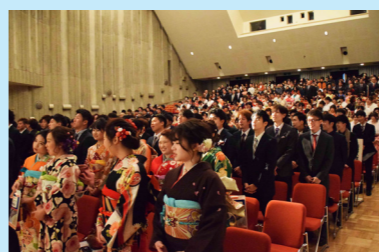
スーツや晴れ着で、式に参加する新成人