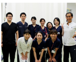
救急総合診療科の職員