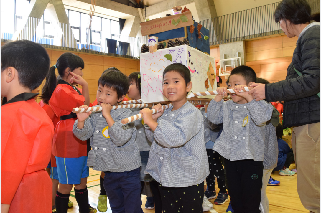
小浜美郷小学校・4保育園交流「秋祭り」(金屋・11月8日)