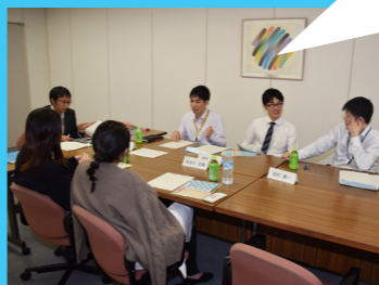
会議で積極的に意見を交わす実行委員たち

同級生や恩師と再会し、ともに大人としての門出を祝う成人式に、みなさんの参加をお待ちしています！