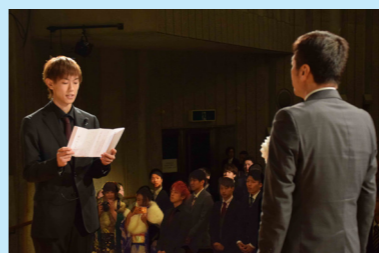
誓いの言葉を述べる新成人代表