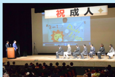
中学3年生当時の恩師が登場し、思い出話で盛り上がったアトラクション