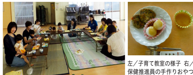
左/子育て教室の様子 右/ 保健推進員の手作りおやつ

各地区で手作りおやつを試食やふれあい遊びを通して、地域で子どもを育てるきっかけづくりを行っています。普段、なかなか顔を合わせる機会が少ない同世代の母と子の交流を深める場になっています。