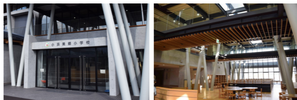
【左上】児童玄関の入口の校章が児童らを「お出迎え」 【上】ラーニングセンターは吹き抜けで、開放感あふれる空間 【左】教室の天井には県産スギ材のほりが見え、自然のぬくもりが感じられる