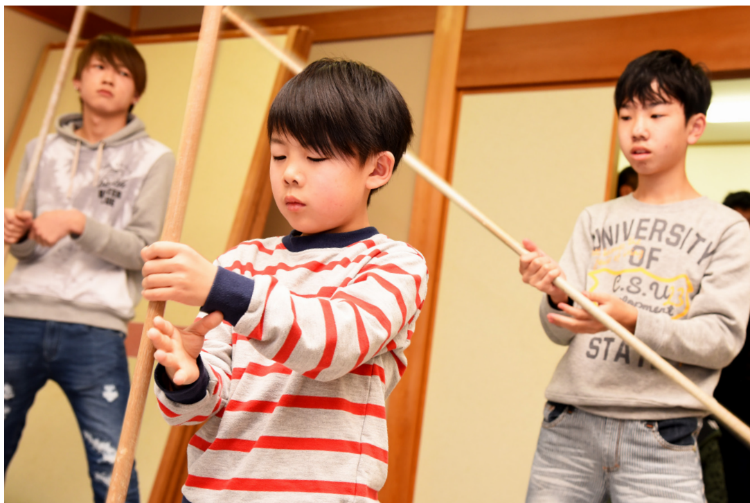
西津七年祭 稽古はじめ（川西会館・2月9日）

漁師町に伝わる七年大祭。 絶やさぬようにと若人たちに受け継がれ、 先人たちが守り伝える地域の誇り。 世代をこえて積み重ねられた伝統とそこに暮らす人々の思いが、 今、新たな時代を紡ぎはじめる。