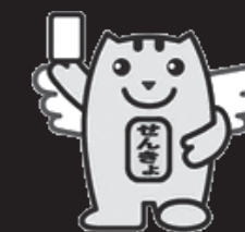
明るい選挙のイメージキャラクター「選挙のめいすいくん」