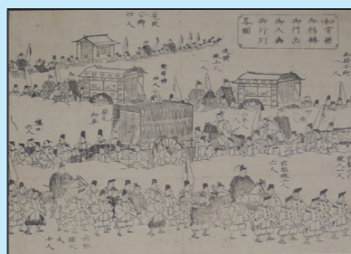
絵図に描かれた「和宮降嫁」の様子