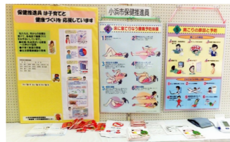
ふるさとまつりで健康に関するパネルを展示

各地区のふるさとまつりで、健康に関するパネル展示や乳がん触診モデルの体験、血圧測定など健康に関する広報活動を実施しています。