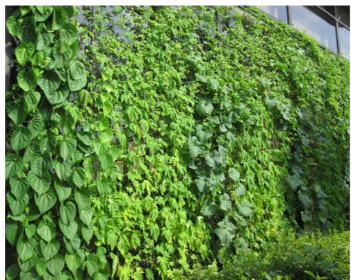
毎年市庁舎で作っているグリーンカーテン