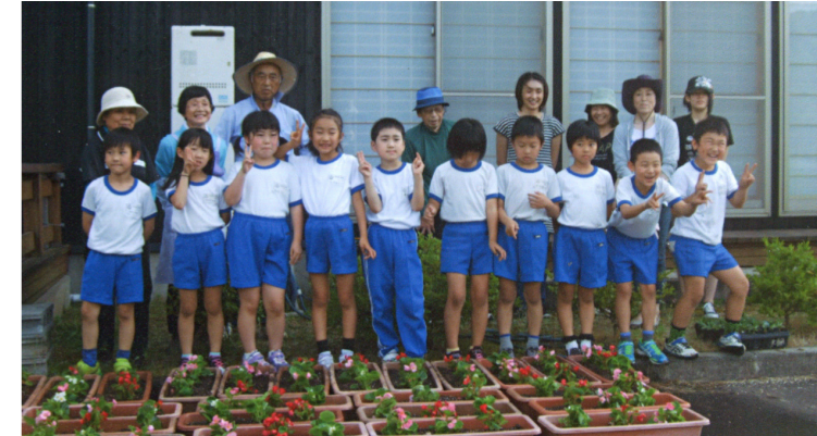
上/地域でふれあいサロンを開催。下/子どもたちとプランターづくり