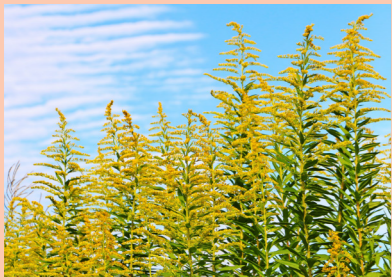
【セイトカアワダチソウ】