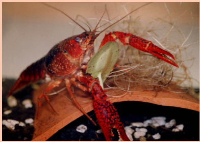
【アメリカザリガニ】